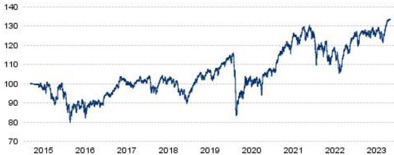
— TOGAEST INVERSIONES FI